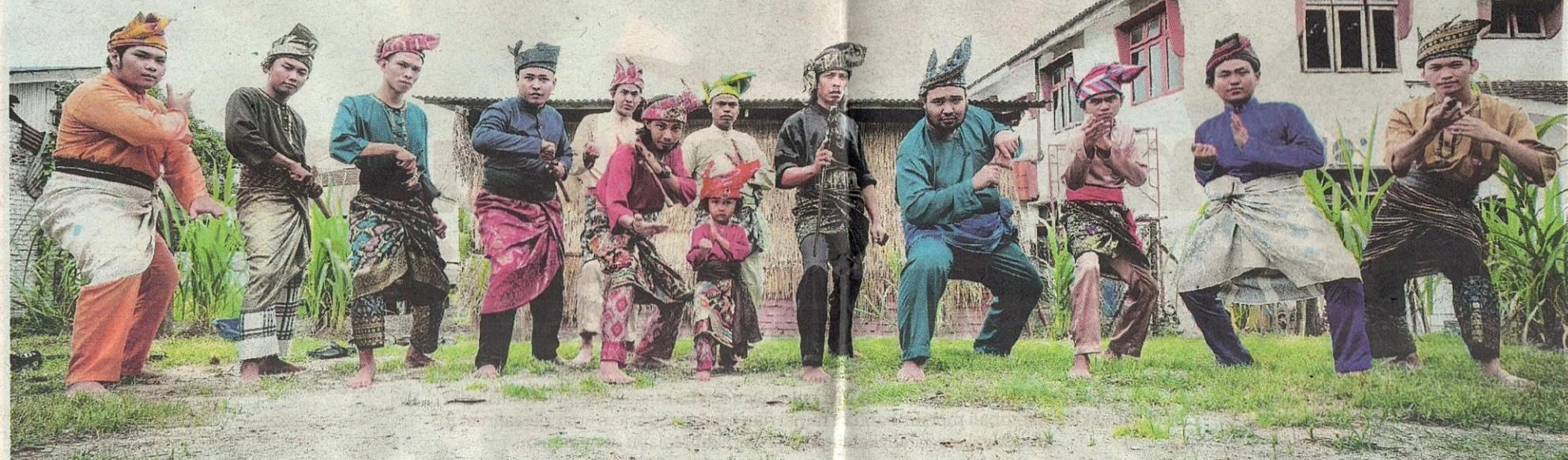
PEMAKAIAN busana Melayu lengkap seperti baju Melayu, samping dan tanjak perlu dipromosi dengan giat bagi menarik minat orang muda mencintai budaya sendiri.