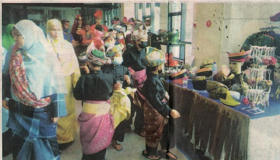
GENERASI muda terpegun melihat senjata dan kostum tradisional yang dipamerkan pada karnival tersebut.

“Kita tidak mahu busana Melayu tradisi ditenggelami busana-busana rekaan moden yang dijual dengan meluas semasa musim perayaan,” katanya.